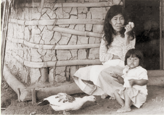
Che yari omboarakua jamarĩro

Añave yaechata Ñanderamĩ jare ñandeyarireta mbae arakuaara omee ñandevevae.