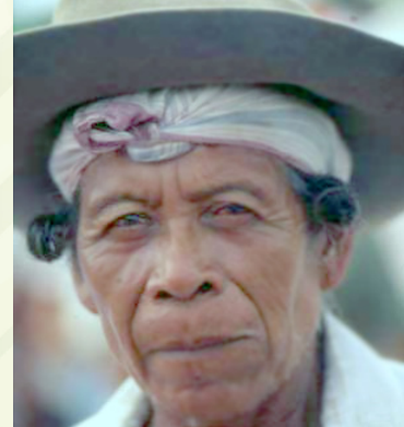
che ramĩ oremboe roparavĩkĩ

Jaerämiñovi yaikuatia ova ñengeti kuae ñee reta ndive yaikuatia mbae mbaravikira oyapo ñande ramĩ jare ñande yari reta ñane rëta rupi.