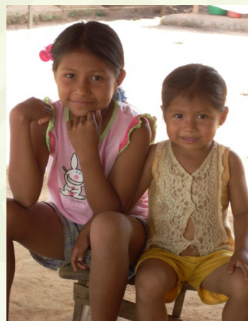
aguapi aï cherikendive

Añave yaeka iru ñee ñande reindi jare ñanderikei reta jee ndive. jare yaikuatia ñande kuatia rirupe.