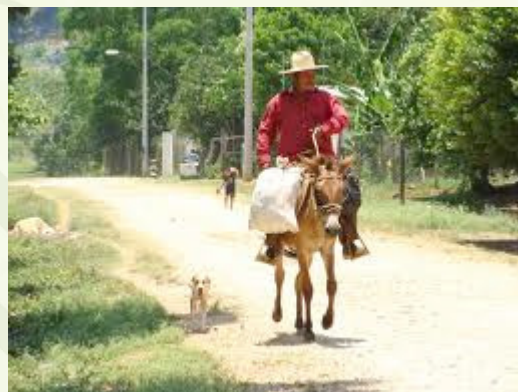
Cheru gueru avati koogui

Añave yaeka jare yaikuatia kuaeñeeretandive irundi ñeegeti reta ñandekuatiarirupe.