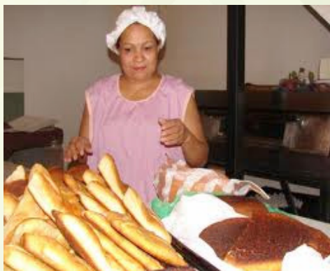
Chesi oyapo guiyape

Añave yaikuata kia kia jae ñane retära reta oiko ñanderetarupivae.