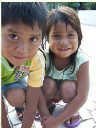
Chereindi jee Arapoti