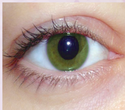
3. - ñanderesa