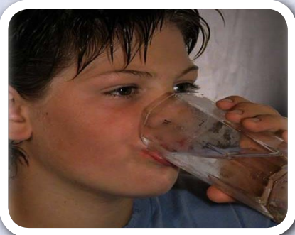
Payqa ch'uya yakuta upyachkan