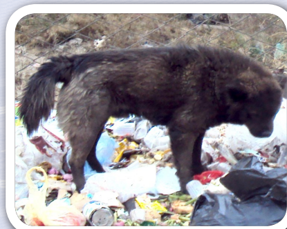
Yana wira allqu mutkhin