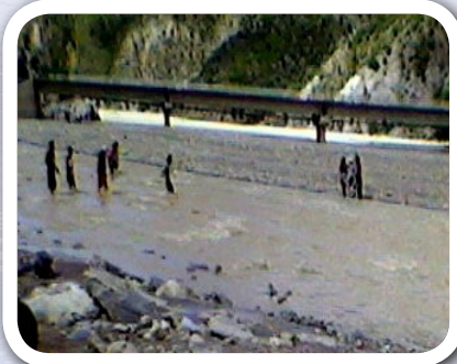
Paykunaqa qhunchu yakupi purichkanku