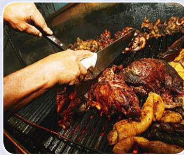
Kankasqa aychata khuchuchkan