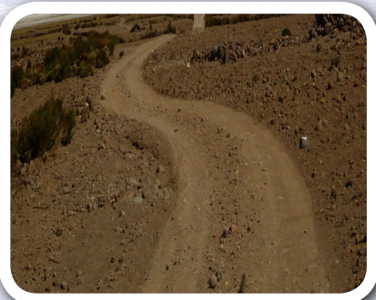
Suyunchikpiqa achkha llink'uñan tiyan

Rimaykunata ñawirispa sutillikunata riqsirisun.