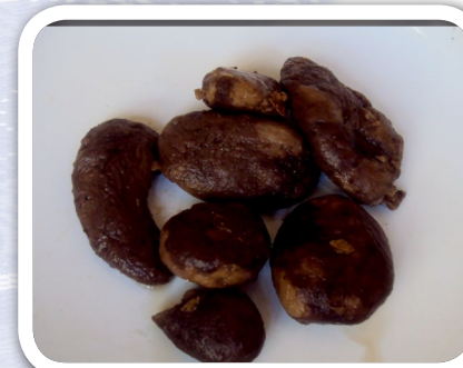
Qam juq'u ch'uñuta mayllanki