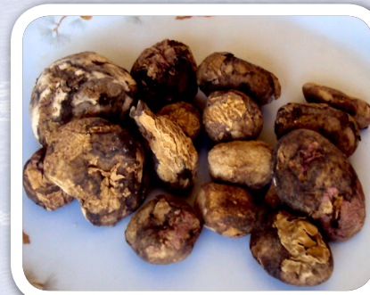
Ñuqa ch'aki ch'uñuta chulluchini