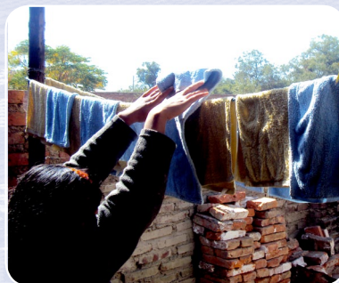
T'aqasqa p'achata ch'akichichkan