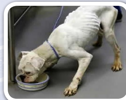
Yuraq tullu allqu mikhun