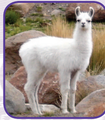
kayqa llama uña